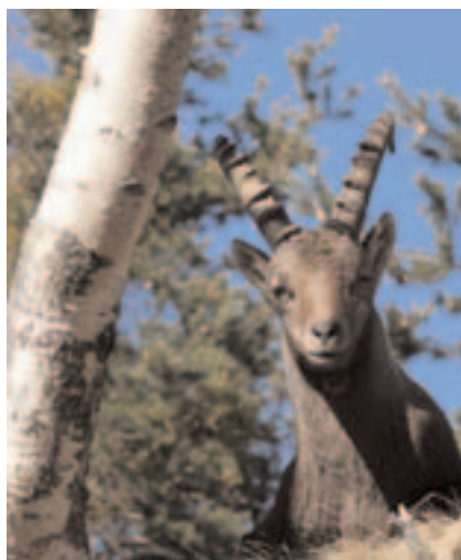
Für «Netz Natur» begibt sich Vinzenz Imboden auf die Spuren der Steinböcke.

Und plötzlich kamen die Tiere zu ihm. Ermöglichten dem Tierfilmer – unwissend natürlich – einen Einblick in ihr Leben. Einmalige, sensationelle Aufnahmen waren das Resultat. Um sich zu vergewissern, dass er nun auf dem richtigen Weg war, nahm Vinzenz Imboden anlässlich des 5. Internationalen Filmwettbewerbs des Fördervereins für Tier- und Naturfilme 2003 in Dortmund teil. Prompt holte er sich mit «Balz der Birkhühner» in der Kategorie Amateure den 1. Preis. «Dieser Wettbewerb ist in Fachkreisen jedoch nicht von grosser Bedeutung», relativiert der Naturfreund bescheiden seinen Sieg. Als persönlichen Höhepunkt bezeichnet er vielmehr den Tag X im Jahre 2002, an dem es ihm gelungen war, den Rivalenkampf zweier Gämbsböcke während der Brunftzeit zu filmen. «Ein solches Schauspiel hat sich während meinen 15 Jahren als aktiver Tierfilmer nur ein einziges Mal geboten.» Mit Stolz und wie sich später herausstellte auch mit Recht bezeichnet